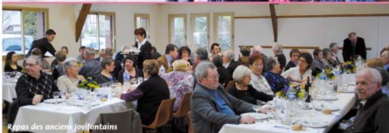
Repas des anciens Jovifontains