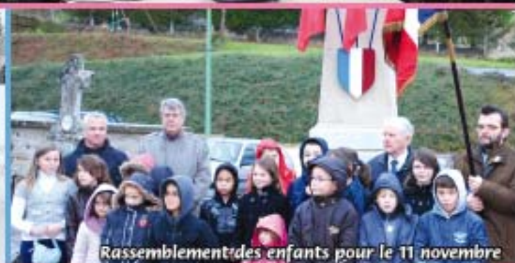
Rassemblement des enfants pour le 11 novembre