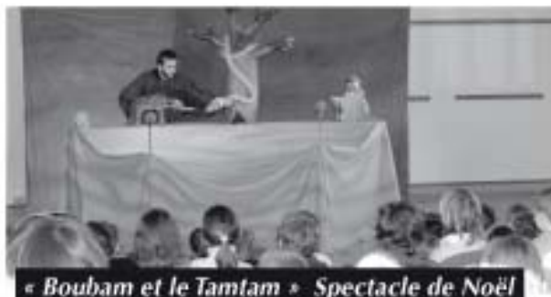
« Boubam et le Tamtam » Spectacle de Noël