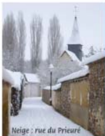
Neige : rue du Prieuré