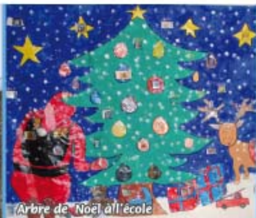
Arbre de Noël à l'école