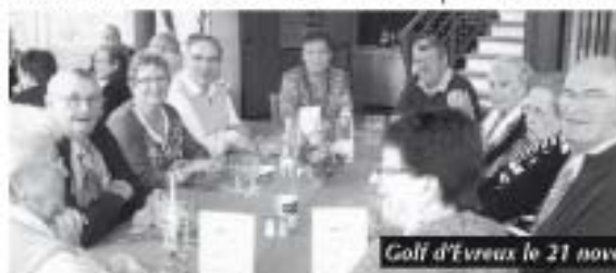
Golf d'Evreux le 21 novembre 2010

Pour les 34 adhérents, le club doit s'adapter aux évolutions et à l'environnement sociologique des nouveaux retraités pour les recevoir dans une structure où chacun trouve sa place et surtout son plaisir. Nous devons ouvrir ce chantier de réflexion avec l'ensemble des intervenants communaux et créer des passerelles inter-générationnelles dans nos activités.