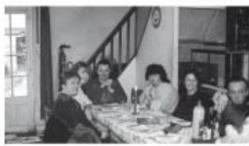
Le pot de départ en vacances de juillet 1993 ne laisse pas présager le triste retour de septembre qui laisse l'ensemble du personnel sans salaire jusqu'à la liquidation de novembre.

Cette société fabriquait tous types de résistances électriques pour l'industrie y compris l'électroménager. L'usine employait dans les années 60 une quarantaine de personnes majoritairement des Jovifontains et Jovifontaines, dans les années 70 une centaine de personnes dont une partie arrivait sur le site par un autocar affrété depuis Evreux.