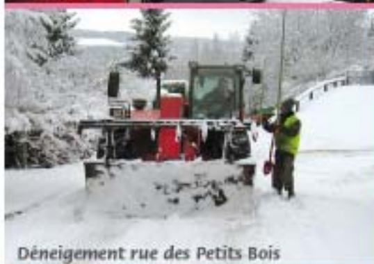
Déneigement rue des Petits Bois