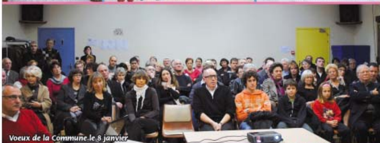
Voeux de la Commune le 8 janvier