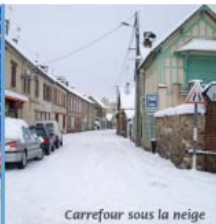
Carrefour sous la neige