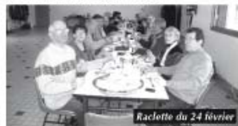
Raclotte du 24 février